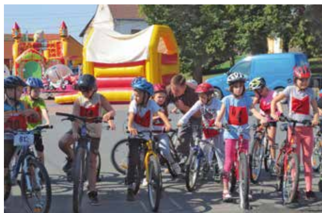
Dospělým Železným Baštěrákům vyrůstá konkurence.