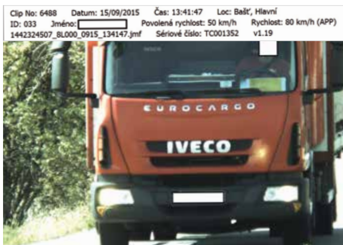
Překračování povolené rychlosti o desítky km/h je bežným jevem.

V příštích týdnech bude probíhat analýza pro zvýšení dopravní bezpečnosti v obci. Výstupem bude bezpečnostní strategie, zahrnující návrhy na zklidnění dopravy a zvýšení bezpečnosti v rizikových místech, například na přechodech pro chodce, v okolí Návsi, v blízkosti dětských hřišť. Se specialisty z firmy AF-CITYPLAN, která předložila nejvýhodnější