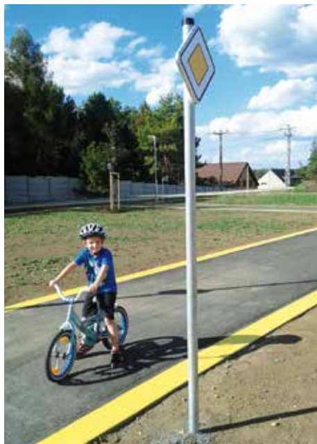
Dopravní hřiště čeká na kolaudaci.