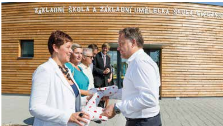
Starostka Baště přebírá symbolický klíč.