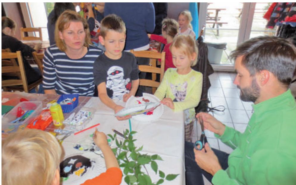
Tvoření se tentokrát účastnily celé rodiny.