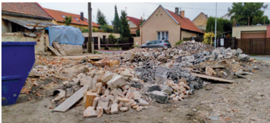
Suť po demolicích stále zůstává na staveništi.

Problémy s rekonstrukcí objektu U Oličů, o kterých jsme se zmiňovali v předchozích vydáních Zpravodaje se v měsících září a říjnu natolik prohloubily, že zastupitelstvo obce rozhodlo o ukončení spolupráce s firmou NISAINVEST s.r.o.