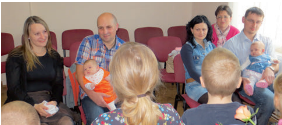
Miminka přivítaly i děti z mateřské školy.