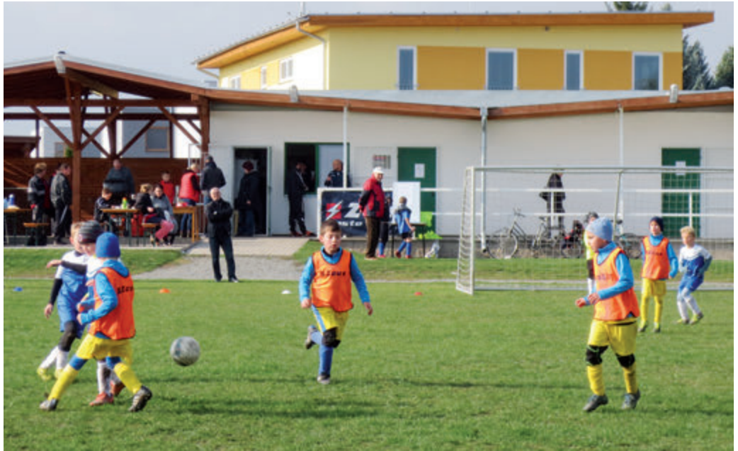
Fotbalové hřiště Bašť hostilo šest družstev mladší přípravy.

V prvních dvou kolech narazila na Radonice a jednoho z favoritů turnaje - Brandýs n. L.-Starou Boleslav. V obou zápasech jsme zvítězili rozdílem jediného gólu vstřeleného v posledních minutách před koncem zápasu.