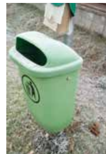
Nepochopitelné chování některých z nás

Nelibost v této lokalitě ohledně koňských trusů asi není ve Vaší kompetenci, i přesto bych na ni ráda upozornila. I po našem upozornění jezdců na koni, že neuklízí trus při projíždkách, zůstává stále nepořádek a to na chodnicích!