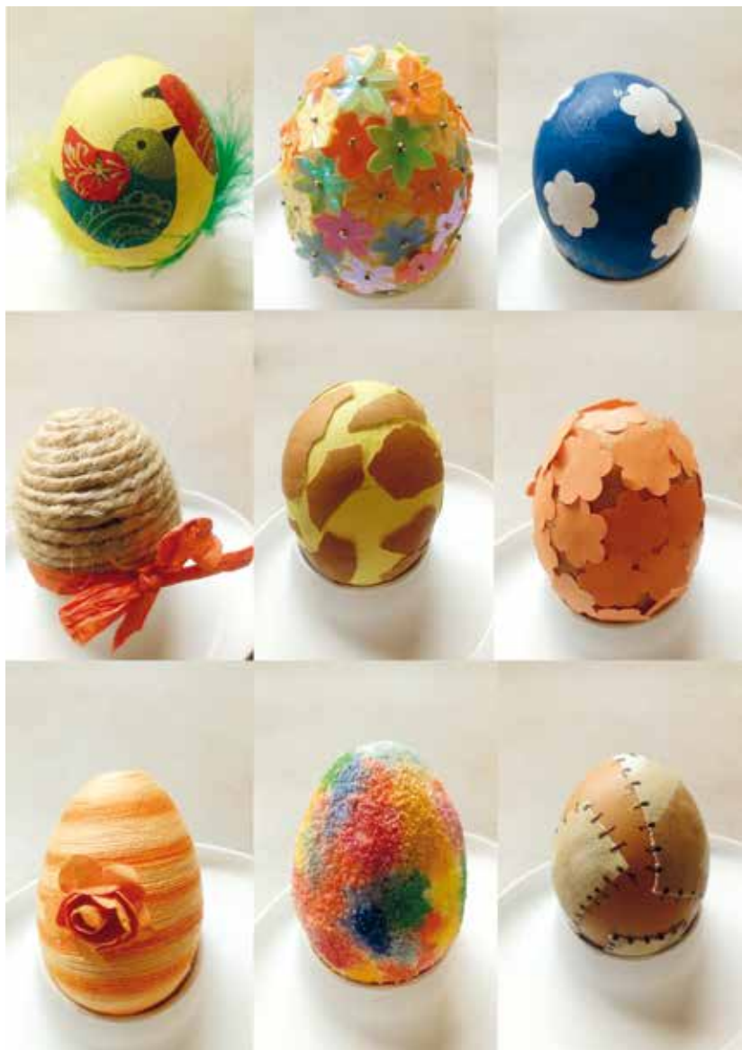
Malá ochutnávka technik, kterými se budou zdobit vajíčka