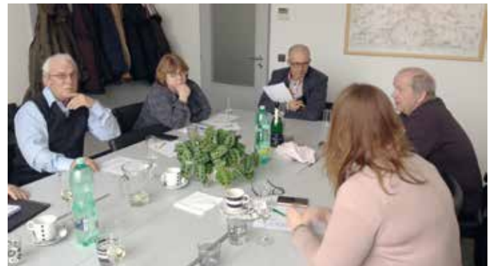
Při jednání SLV se symbolicky připilo na zrušení hlukového pásma

( cuc, sta s využitím materiálů Economia, a.s. )