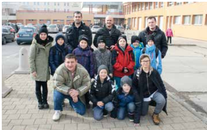
Baštěcká fotbalová příprava v centru Popradu