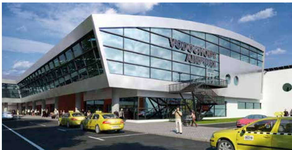
Vizualizace budoucí podoby mezinárodního letiště

Od prodeje společnosti Aero Vodochody skupině Penta uplynulo již deset let. Aktivní vystupování obcí a dalších iniciativ proti záměru rozšíření letiště tak vstupuje do druhého desetiletí boje. V červnu 2016 ministr životního prostředí Richard Brabec oznámil, že posudek EIA je nutné aktualizovat. V únoru tohoto roku vydalo Ministerstvo dopravy Rozhodnutí, kterým zrušilo vydané stavební povolení pro stavbu odvodnění odbavovací plochy západ letiště Vodochody a Městský soud zrušil opatření obecné povahy, kterým Úřad civilního letectví stanovil ochranné hlukové pásmo. Skupině Penta se tak opět komplikují plány na rozšíření letiště ve Vodochodech.