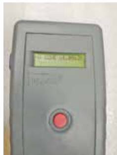
Čtečka čipů