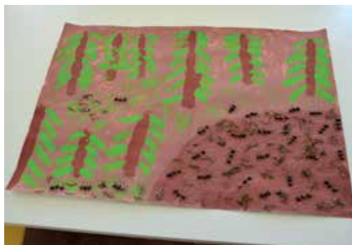
Oceněná práce dětí MŠ Bašť