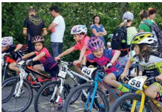
Start dívčí kategorie cyklistického mistrovství regionu