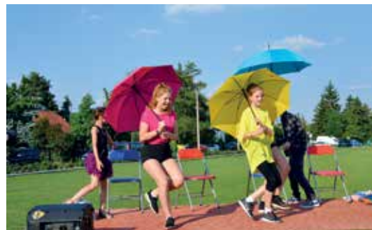
Dětem přišly zazpívat herci z pražských muzikálů

V sobotu 26. května se v rámci oslav Dne rodiny uskutečnilo Setkání sousedů nad Prahou. Pozvání přijaly a své dovednosti prezentovaly děti z Mažoretkového klubu Beruška z Odolené Vody, AP aerobic clubu z Hovorčovic, představily se Andělky z Úzic a uskupení Tělo v pohybu z Měšic. Početné zastoupení bylo z Líbeznic, anglicky zarecitovaly děti z kroužku Živá angličtina, zazpívaly a na flétny zahrály děti se svými maminkami navštěvující YAMAHA Class a zatancovala děvčata ze Zumbadance spolku Sto-