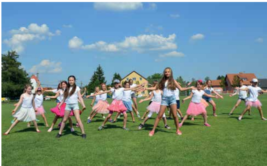
Den rodiny v Bašti byl slunečný, veselý, barevný, hravý

V pátek 25. května se jedenáct týmů škol regionu MAS Nad Prahou utkalo o poháry, medaile a další věcné ceny ve víceboji, který se skládal jak z pohybových, tak vědomostních aktivit. Baště měla své-