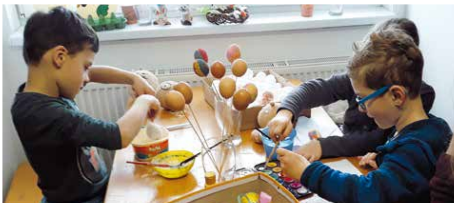
Děti si ozdobily přes stovku vyfouknutých vajíček.