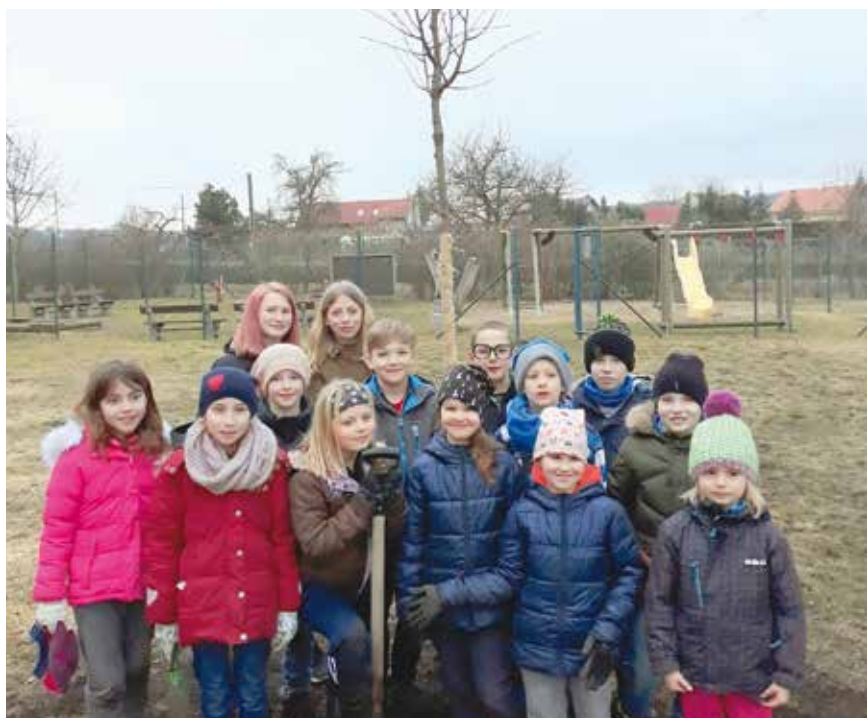
Děti při Noci s Andersenem vysadily lípy v parku u knihovny.

Stromy svobody symbolizují vznik Československé republiky a v letech 1918 a 1919 jich lidé vysadili tisíce. Do výsadby se zapojili starostové, žáci, členové místních spolků. Stromy byly ověšené stuhami, domy praporečky, zpívala se hymna, ke kořenům se ukládaly pamětní listy. A sázely se i v pozdějších letech (1928, 1945, 1968) vždy, když si lidé chtěli připomenout a oslavit význam svobody a demokracie.