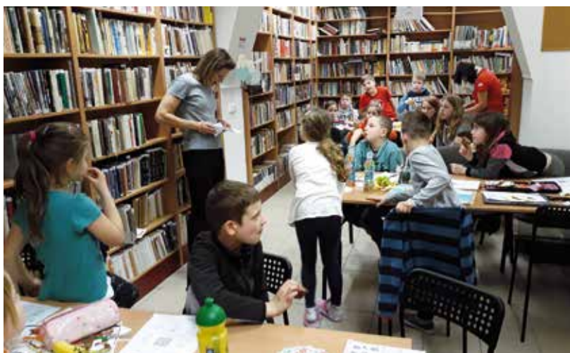
Děti mají knihy stále rády.

Necelé dvě desítky malých čtenářů prožily svou další noc v knihovně. Bašť se baví ve spolupráci s obcí Bašť připravila pro malé nocležníky program plný čtení, luštění, tvoření, ale i pohybu na čerstvém vzduchu. Po výsadbě dvou lip do aleje v parku u knihovny následovalo hledání informací o těchto stromech. Děti svým kamarádům představily své oblíbené knihy, ze kterých si přečetly krátké úryvky. Čtení bylo přerušováno nejrozličnějšími kvízy, hádankami, křížovkami, osmisměrkami nebo výrobou hýbající se ovečky. Před desátou hodinou prošly děti stezkou odvahy, kterou pro ně připravili členové CYKLO TEAM BAŠŤ a před půlnocí už byly všechny ve svých spacích pytlích a sledovaly pohádku před usnutím. Děti si na památku nocování v knihovně odnášely knihu, originální pohlednici Noci s Andersenem, poukázku na audioknihu, především ale spoustu zážitků.