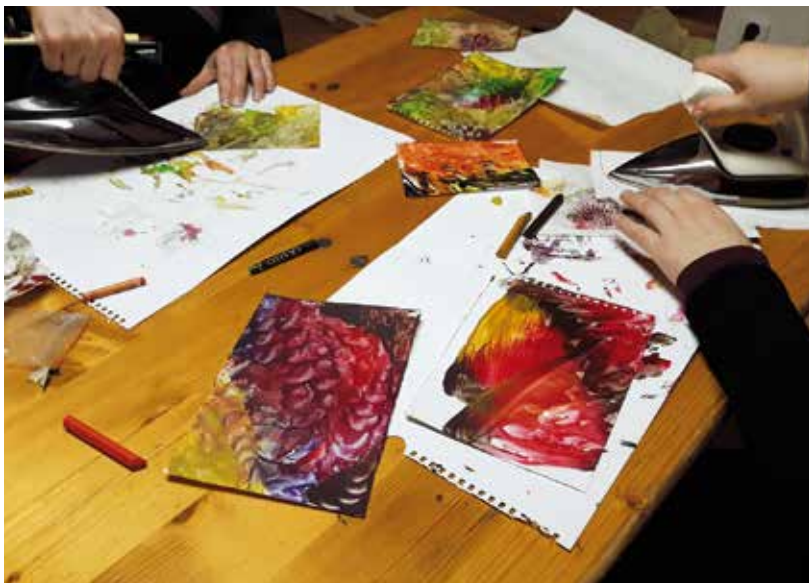
Příjemné chvílky se žehličkou zažily účastnice kurzu enkaustiky.

Že se i se žehličkou dají zažít příjemné chvílky, se přesvědčila desítka účastnic březnového Pátku v Pohodě. Bylo pro ně připraveno seznámení s malířskou technikou starověkého antického původu, při níž se užívalo barviv třených se zvlášť připraveným voskem. Enkaustická malba, známá též jako malování horkým voskem, využívá horký vosk, do kterého je přidán barevný pigment. Tato tekutá pasta je poté aplikována na povrch — obvykle upravené dřevo, případně plátno, leštěný papír, nebo další často používané materiály. V Pohodě účastnice používaly voskovky na leštěný papír. Výsledek si budete moct prohlédnout na výstavě v knihovně od 9. dubna během půjčovní doby.