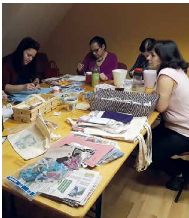
Soustředění účastnic prvního letošního Pátku v Pohodě nad vlastní tvorbou