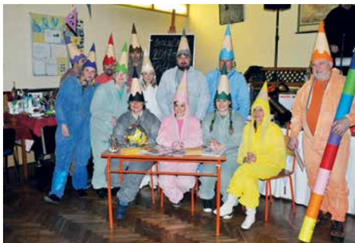
Při květinových plesech se dospělí vždy dobře baví