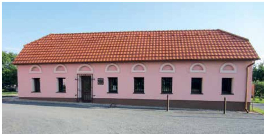
Knihovna sídlí od roku 2010 v samostatném zrekonstruovaném objektu