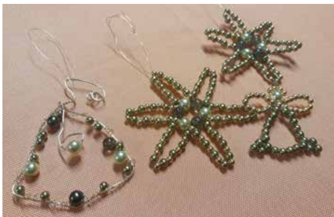
Vánoční ozdoby z korálků z rukou šikovné účastnice

Předvánoční atmosféru navodila také výroba vánočních ozdob z korálků, která byla tématem posledního Pátku v Pohodě. Ten byl zároveň poslední akcí pořádanou spolkem Bašť se baví v roce 2017. Členky spolku děkují účastníkům akcí za přízeň a podporu v roce 2017, přejí všem občanům obce hodně zdraví, štěstí, lásky a úspěchů v roce 2018 a těší se na setkávání při tradičních i nových akcích příštího roku.