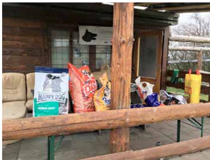
Návštěvníci přinášeli především krmení pro psy