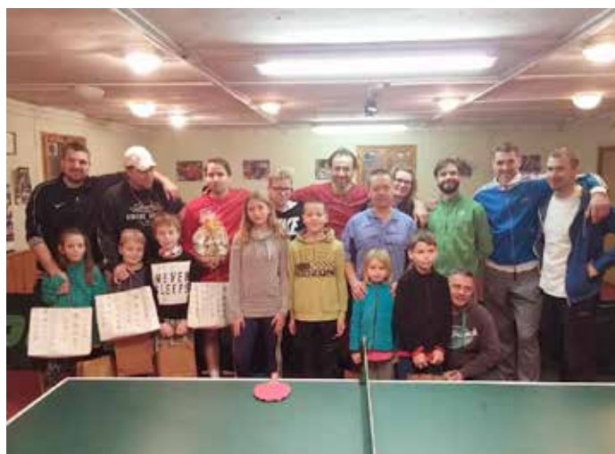
Nejmłodšího a nejstaršího účastníka dělilo přes 40 let