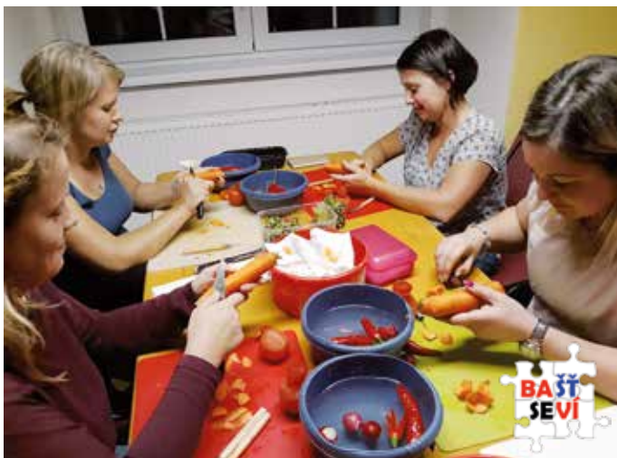
Nepřipravoval se mrkvový salát, ale vyřezávaly se kytičky