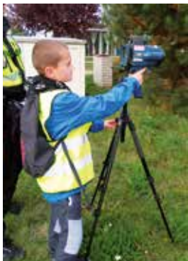
Děti z Mladého strážníka si vyzkoušely práce s radarem

Dne 4.10. uspořádali strážníci OP Líbeznice pro děti ze zájmového kroužku Mladý strážník měření rychlosti v obci Bašť v lokalitě Nová Bašť jako součást kampaně na připomenutí nejvyšší povolené rychlosti v obytných zónách a na ulici Mělnické. Měření probíhalo od 17 do 18 hod. Děti si mohly vyzkoušet práci se silničním rychloměrem a řidičům rozdávali smajlíky za dodržení předepsané rychlosti v obci. Pozitivní bylo, že za celou dobu měření rychlosti žádný řidič nepřekročil rychlost a to v obou směrech.