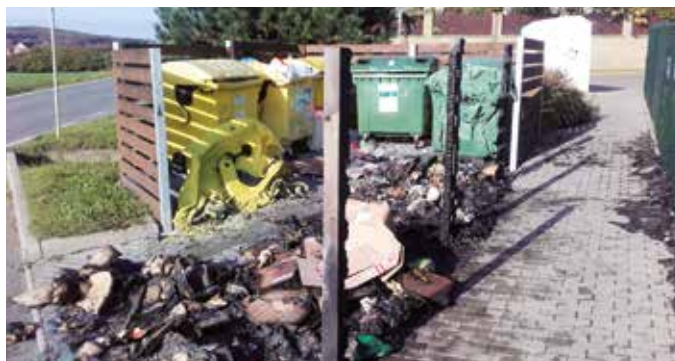
Škoda na stanovišti kontejnerů dosáhla 100 tisíc korun