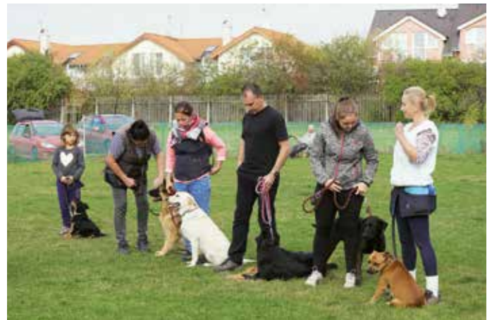
Desítky psů se ucházely o tituly v několika kategoriích