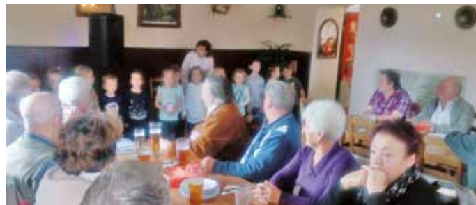
Seniorům k jejich svátku přišly zazpívat děti z MŠ