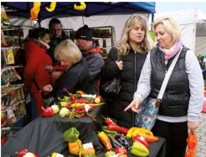
Prodejní nabídka na výstavě byla bohatá