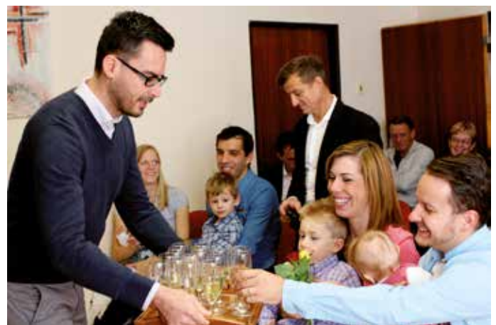
K slavnostním okamžikům patří přípitek