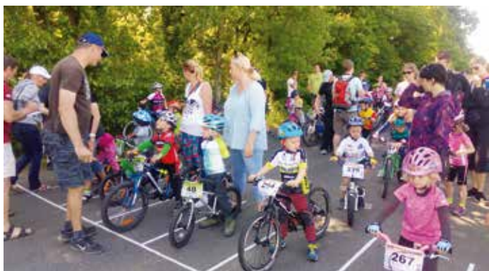
MAS Nad Prahou je sponzorem cyklistických závodů

Obec Bašť připojila své území pro činnost Místní akční skupiny Nad Prahou a zároveň se stala partnerem MAS, což jí umožňuje nominovat své zástupce do orgánů MAS a aktivně se účastnit Valné hromady. MAS Nad Prahou se v programovém období bude podílet na budování rodinných a komunitních center, bude podporovat sociální podnikání, výstavbu cyklostezek, přispěje k financování výstavby mateřských a základních škol. Podpoří zemědělské i nezemědělské výrobce, investice budou směřovat i do lesů a v neposlední řadě podpoří činnost spolků. Podpoří projekty více než 100 milionů z Evropských strukturálních fondů.