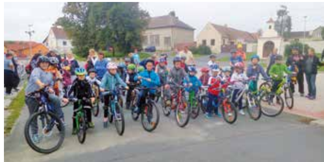
Necelé tři desítky dětí na startu Dětského Železného Baštěráka

V rámci Loučení s prázdninami proběhl sedmý ročník Železného Baštěráka. Pořádající CYKLO TEAM BAŠŤ děkuje všem účastníkům za statečné výkony