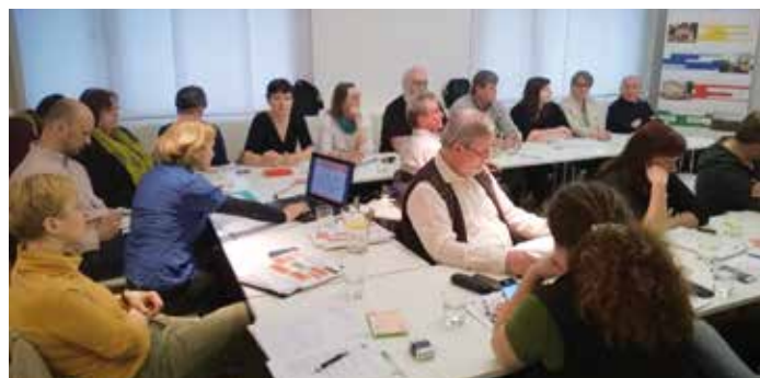
MAS Nad Prahou se podílí na vzdělávání

„Místní akční skupiny by měly výrazně přispívat k lepšímu životu v jednotlivých regionech naší republiky a díky znalosti lokálního prostředí efektivněji řešit konkrétní problémy... Místní akční skupiny tak mají skutečný potenciál naplnit smysl své existence a výrazně zlepšit konkurenceschopnost jednotlivých regionů,“ uvedla nedávno ministryně pro místní rozvoj Karla Šlechtová. (cuc, NS MAS ČR)