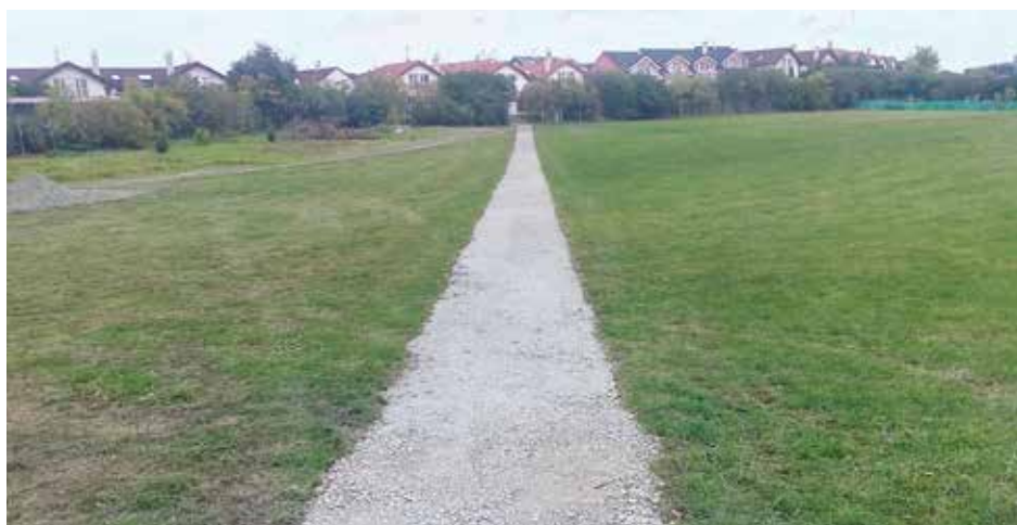
Z Nové Baště na cyklostezku bezpečněji