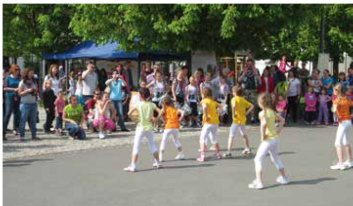
MAS Nad Prahou pořádá tradiční Setkání sousedů

Zlepšení kvality života obyvatel na venkově, propojování místních aktérů, získávání a rozdělování dotačních prostředků i podpora turistického ruchu v regionu je cílem Místních akčních skupin (MAS). Jsou důležitým článkem komunitně vedeného místního rozvoje v České republice. S jejich pomocí se opravovaly hasičské zbrojnice, místní komunikace, knihovny, sokolovny, křížky a kapličky, stavěly spolkové domy, hřiště, muzea, rozhledny nebo naučné stezky. V letech 2007 až 2013 získaly MAS na realizaci strategických plánů rozvoje regionů z Programu rozvoje venkova (PRV) 5,3 miliardy korun. V programovém období 2014–2020 je tato částka více než trojnásobná.