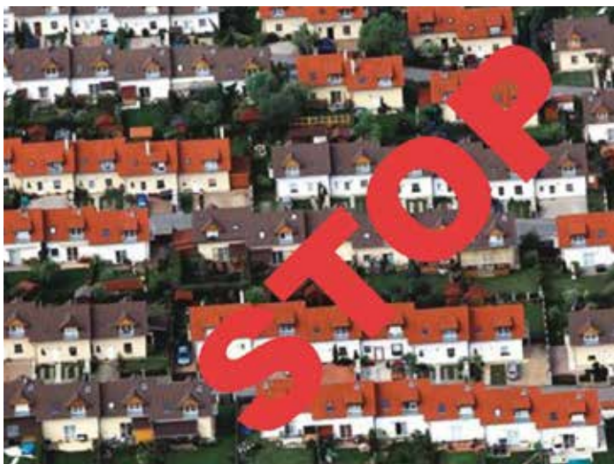
Územní plán vystavil stopku další masivní výstavbě