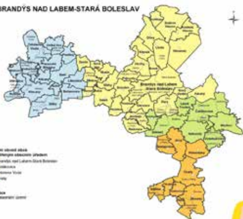
SO ORP BRANDÝS NAD LABEM-STARÁ BOLESLAV

Pro tyto průkazy a povolení budete muset navštívit místně příslušný úřad – městský úřad Brandýs nad Labem – Stará Boleslav .