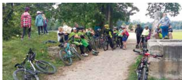
Trasa podzimního cyklovýletu zavedla účastníky do parku u veltruského zámku