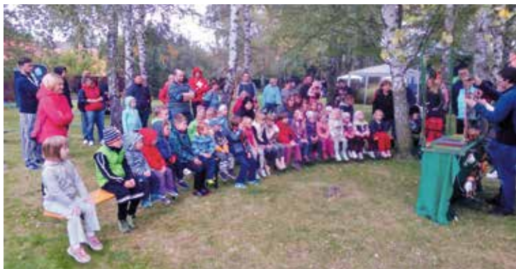
Divadlo Honzy Hrubce je vždy zárukou zajímavého představení