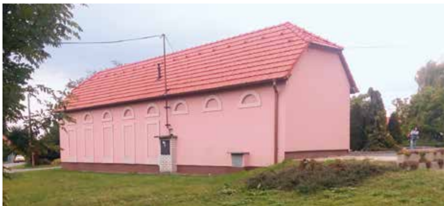
Co dál s prostorem za knihovnou?