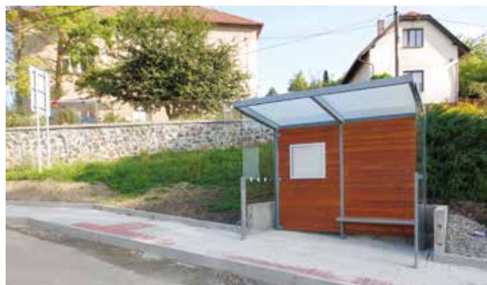
MAS Nad Prahou opravila 34 autobusových zastávek regionu

Činnost MASEk podporuje i ministr zemědělství Marian Jurečka: „Ministerstvo zemědělství vždy podporovalo rozvoj venkovských aktivit na místní úrovni, protože pouze lidé, kteří v daném území sami žijí, mohou mít nejlepší povědomí o konkrétních potřebách jeho rozvoje a dalšího zvelebení. Právě Místní akční skupiny sdružující obce, místní podnikatele, zemědělce i další aktéry, stojí v první linii veřejných zájmů, kdy se dá něco hmatatelného ke zlepšení podmínek místních obyvatel skutečně zrealizovat. Ministerstvo zemědělství má bohaté zkušenosti s naplňováním metody Leader z minulého programovacího období a i do budoucna se jeví nabídka z Programu rozvoje venkova v tomto ohledu jako nejatraktivnější a nejlépe uchopitelná. Jsme připraveni naše působení v tomto ohledu dále vyhodnocovat a ve střednědobém horizontu ještě vylepšovat ve prospěch řešení nejpálčivějších problémů, které venkov potkávají, abychom zabránili odchodu zejména mladých lidí do měst a venkovu vrátili jeho obraz kulturního a přírodního dědictví pro celou naši společnost.“