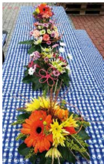
Součástí výstavy byly ukázky vazeb květin

Výstava ovoce a zeleniny se konala v Bašti dne 16. 9. 2017 v zapůjčených prostorách OÚ Bašť. Výstavních exponátů se nám sešlo víc než dost a tak všechny stoly byly plné jablek, hrušek, hroznového vína, rajčat, paprik..... Byly zde zastoupeny i exotické druhy zeleniny, jako například indická okurka a ačokču. Součástí výstavy byla i ukázka vazby květin, kdy si mohli