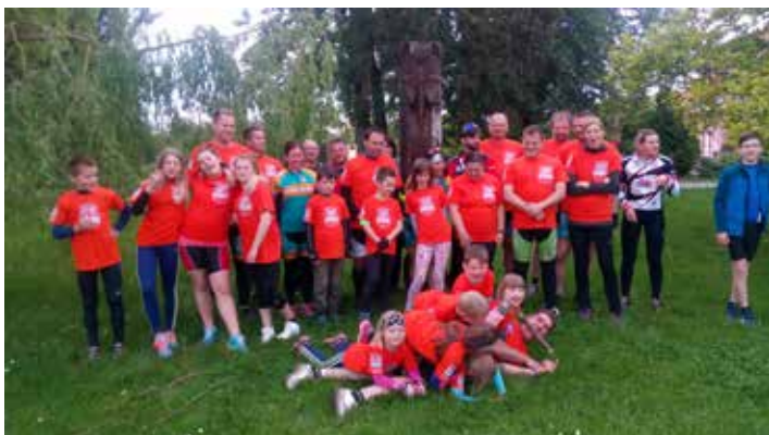
Účastníci jarního Kolem kolem Baště

Úspěšnou jarní akci si zopakujeme společně s CYKLO TEAM BAŠŤ i na podzim.