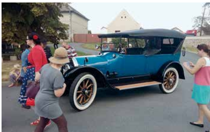
Tento a další krasavci byly k vidění na Návsi při Klecanské rallye