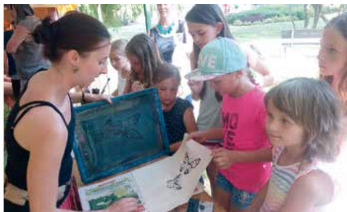
Komedianti na káře s sebou přivezli i středověký jarmark