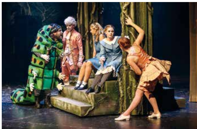
Úžasné kostýmy v představení Alenka v kraji zázraků