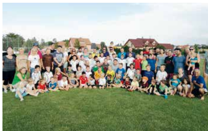
Děti, trenéři, rodiče a příznivci juniorského fotbalu při prázdninové rozlučce Foto: