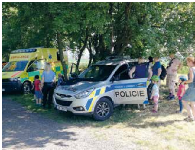
Techniku a vybavení předvedla OP v rámci Dnů nad Prahou

V prvním červnovém týdnu uspořádali strážníci OP Líbeznice již tradiční přednášku pro děti z MŠ Bašť, zaměřenou na bezpečné chování v dopravě, v automobilu a bezpečné chování obecně.