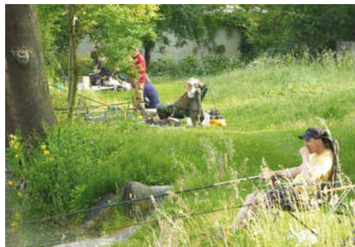
Rybáři mají nekonečnou trpělivost.