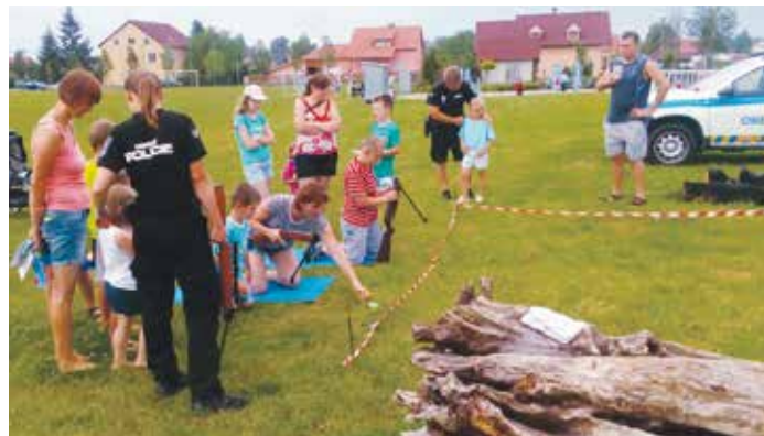
Střelba ze vzduchovky je tradiční aktivitou.