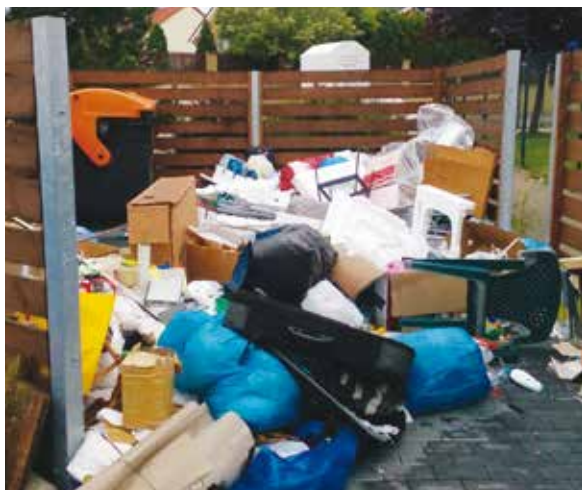
Na začátku byl jeden odložený pytel mimo kontejner.

Nejsou ukryté v lesích, remízcích, příkopech nebo hůře přístupných místech nezastavěné části katastru obce. Přímo uprostřed obydleného území v Nové Bašti a Nad Dvorem vznikly černé skládky u stanovišť nádob na tříděný odpad.