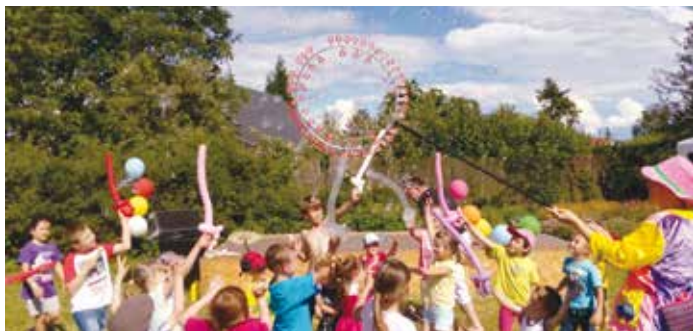
Vytváření bublin si děti samy vyzkoušely.

Poslední dvě červnové soboty proběhly v Bašti akce věnované dětem. Nejdříve opožděné oslavy Dne dětí. Na dopolední dětské rybářské závody navázal odpolední Den se Zlatou rybkou. Desítky dětí se bavily vodnickými taškařicemi s vílou Elvírou, bublinováním, sledováním pohádky nebo tvořením dřevěných obrázků. Kolotoč a skákací hrad doplnil tolik populární aquazorbíng nebo třípytivé tetování. Počasí opět přálo a tak na akci neupěl ani stín, ani mráček.