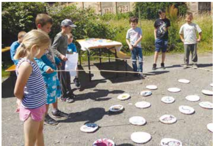
Dětem šlo lovení lépe na suchu.