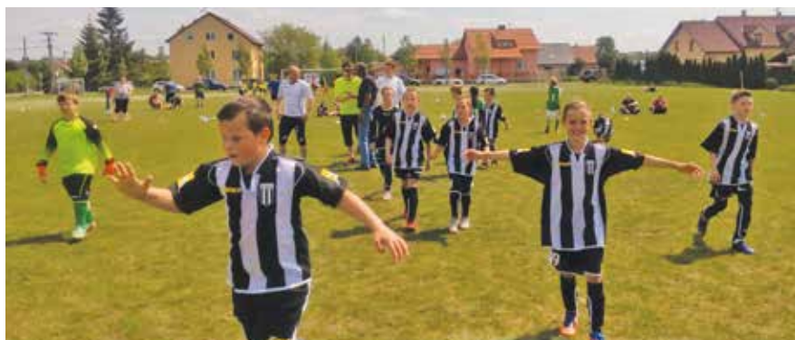
Hráči starší přípravy SK Bašť po vítězném zápase.

Starší příprava získala druhé místo na fotbalovém turnaji, jehož pořadatelem byla fotbalová příprava SK Bašť. Přidala tak další úspěch k prvnímu místu z turnaje ve Stříbrné Skalici.