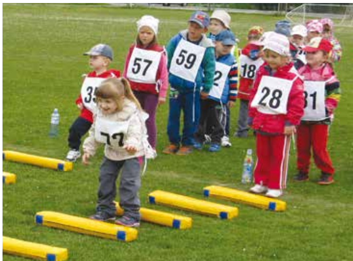
Jednou z disciplín olympiády byl přeskok přes překážky.

Děti se tak mohly vžít do role sportovců, kteří se snaží dosáhnout co nejlepších výsledků. Malí sportovci si vyzkoušeli několik disciplín. Byl to slalomový běh, skok do dálky, hod míčkem do dálky, přeskok přes překážky, přetahování lana.