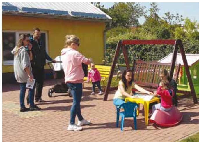
Při cestě k Naučné stezce týmy zavítaly i do školky.