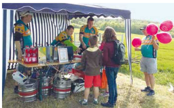
Členové CYKLO TEAM BAŠŤ v plném nasazení.