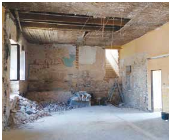
Bývalou restauraci U Oličů bychom poznali už jenom podle pozůstatku výmalby.