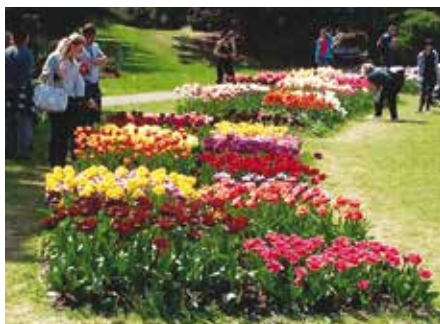
Rozkvetlé tulipány v Dendrologické zahradě v Průhonicích