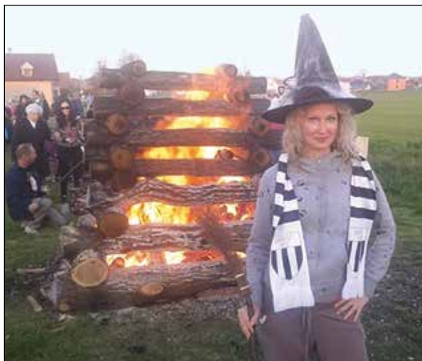
Hranice i některé čarodějnice byly velmi pěkné.