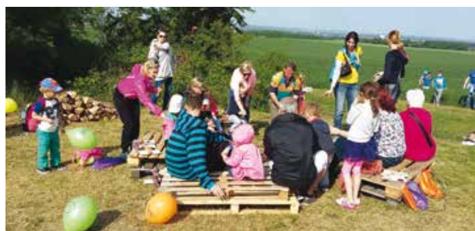
V cíli si každý mohl opéct buřtu.