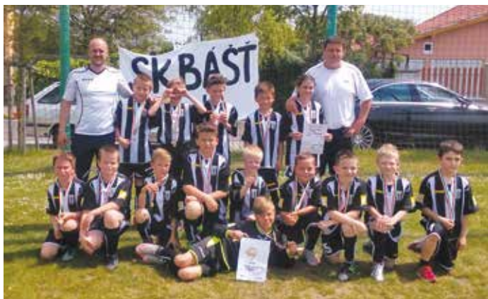
Fotbalová příprava SK Bašť s trenéry po turnaji v Bašti.

V sobotu 21. května se konal další z turnajů okresní fotbalové soutěže. Turnaj byl trochu výjimečný tím, že se konal u nás a jednalo se o první námi organizovaný turnaj starší přípravky vůbec. I z toho důvodu jsme se snažili organizaci nepodcenit a upřímně myslím, že se turnaj vydařil. Moc rád bych poděkoval obci a všem dalším, kteří nám pomohli a vyšli vstříc. A věřte, nebylo jich málo - je třeba propagace, ceny, diplomy, (otevřený) kiosek, rozhodčí, časomíra, občerstvení pro děti, audio aparatura a spousta dalších věcí.