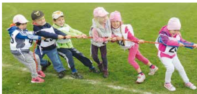
Do přetahování lanem děti vložily všechny své síly.