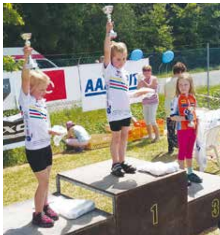
Bašť měla své zastoupení na stupních vítězů cyklistického závodu.

Cyklistické závody pro širokou veřejnost XCO Beckov se uskutečnily v neděli 22. května na trati na hranici katastrů obcí Klíčany a Bašť. Pořadatelé závodu ze Sokola Veltěž s podporou MAS Nad Prahou připravili již 3. Mistrovství regionu Nad Prahou v závodech na horských kolech. Cyklistickými mistry se tak mohli stát i amatérští cyklisté zařazení podle věku do celkem 23 kategorií.