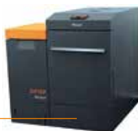
Peletové kotle Biopel Line 10 – 40 kW