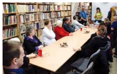
Besedovat se zástupci Policie ČR a BESIP přišli především seniory.