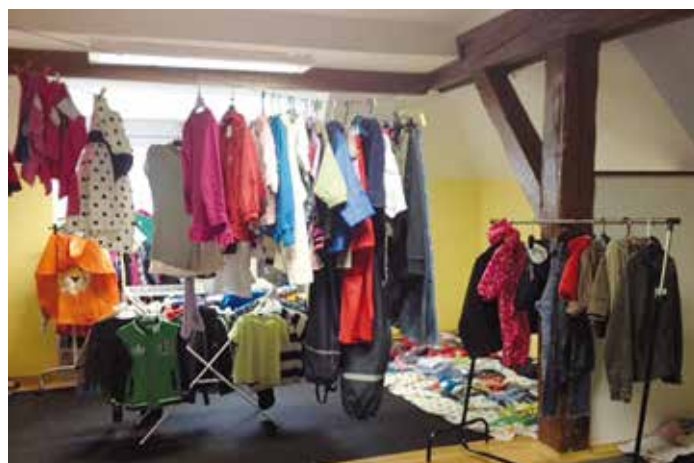
Bazárek nabídl spousty oblečení.