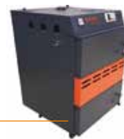
Zplyňovací kotel Ecomax 50 kW