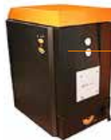
Kotle na uhlí - ruční přikládání H416 EKO-U