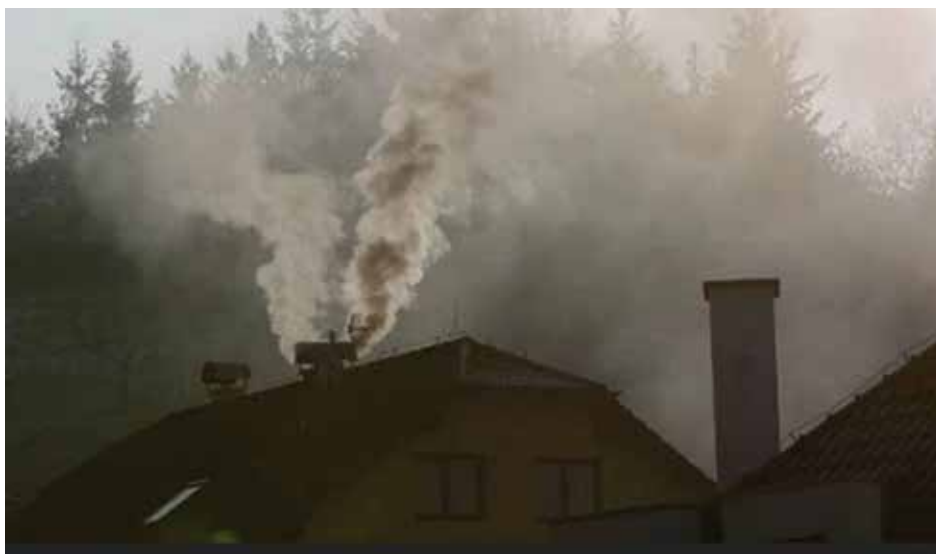
Kotlíkové dotace pomohou ke zlepšení kvality ovzduší.

(cuc, s využitím materiálů Středočeského kraje)