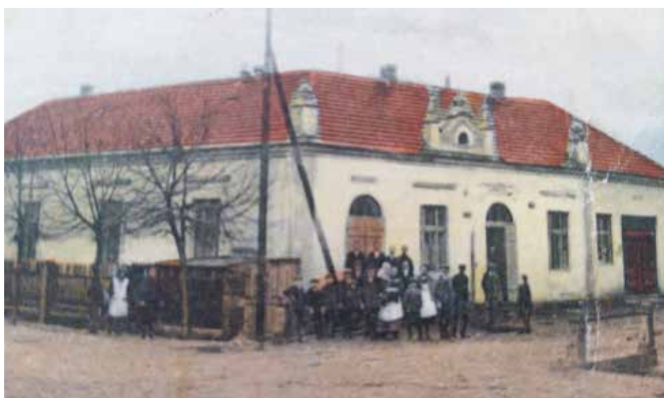
Historická podoba objektu U Oličů před rokem 1928.

„Kdo bude provozovat hospodu v obci je vždy velké téma. Abychom nikoho neopomenuli a dali šanci všem zájemcům, opakovalo se výběrové řízení dokonce třikrát. Vše probíhalo naprosto transparentně, výzvy byly zveřej-