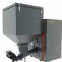
Automatický kotel na uhlí H824 - A 24kW