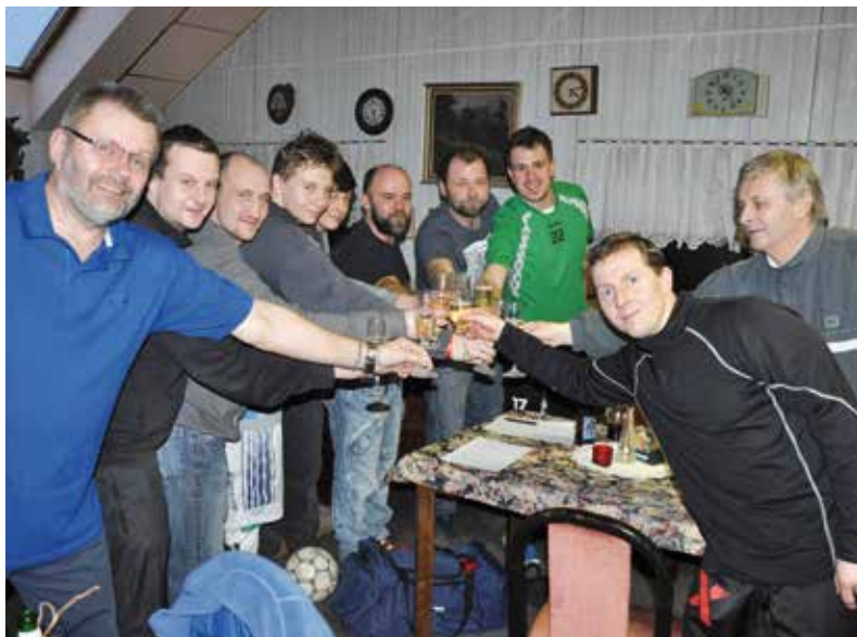
Přípitek vítězných družstev Zimního nohejbalového turnaje.