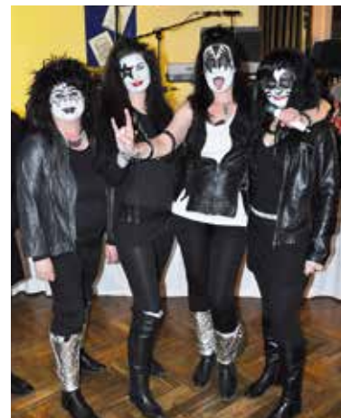
Květinový ples se nesl v duchu světových osobností.

žení „Baštěcké ženy“. Ples plný country muziky od hudební skupiny Kapelníci účastníci protančili v oblečení v country stylu.