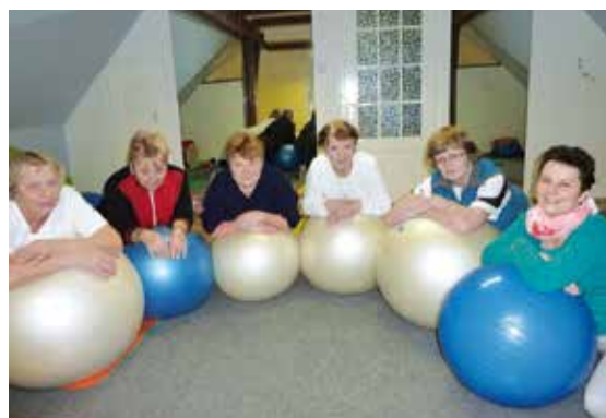
Balanční míče většinou slouží ke cvičení.