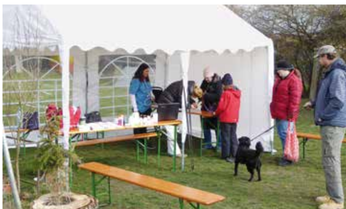
Na psí louce dorazila mobilní veterinární ordinace.