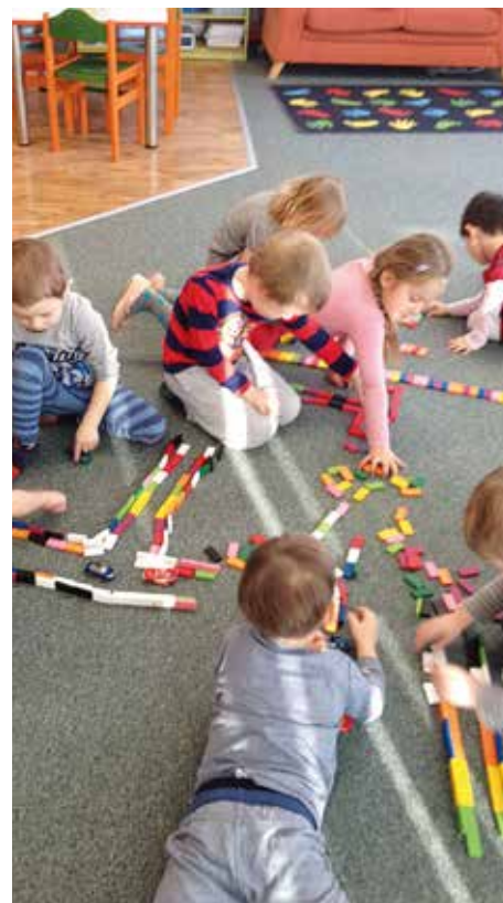
Ilustrační obrázek.