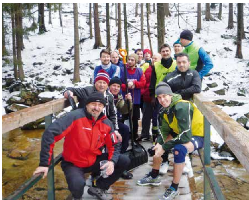
Fotbalisté v rámci zimní přípravy navštívili Mumlavské vodopády.

Pokud se chcete dozvědět, co Výběhu na Čápa předcházelo i jak zimní vysokohorská příprava fotbalistů SK Bašť dopadla, přečtěte si nový Zpravodaj SK Bašť. K dispozici je v Pivnici U Zelenků a ve stánku občerstvení při domácích zápasech SK Bašť.