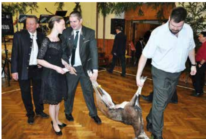
Myslivci připravili skutečně bohatou tombolu.

Je konec března a máme za sebou tři plesy tohoto roku, které pořádají spolky z Baště. Jako první plesová akce se v polovině února uskutečnil Květinový ples, pořádaný zahrádkáři, který se letos nesl ve stylu světových osobností. Vydařené masky osobností pobavily celou společnost tohoto večera. K tanci a poslechu hrála hudební skupina Harmonie, která se zahrádkářům osvědčila i v letech předchozích. Druhým plesem této sezony byl Myslivecký ples, který se konal následující týden. Na plese hrála hudební skupina Krédo, též již publiku známá z předchozích let. Myslivecké sdružení se postaralo o bohatou tombolu, která byla vyvrcholením celého večera. Třetím plesem byl Country bál v polovině března a jeho pořadatelem bylo sdru-