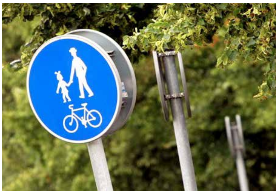
Ilustrační obrázek.