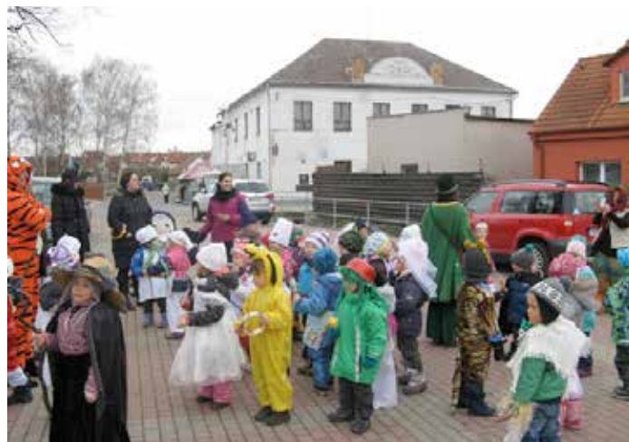
Masopustní rej všech tříd na Návsi.