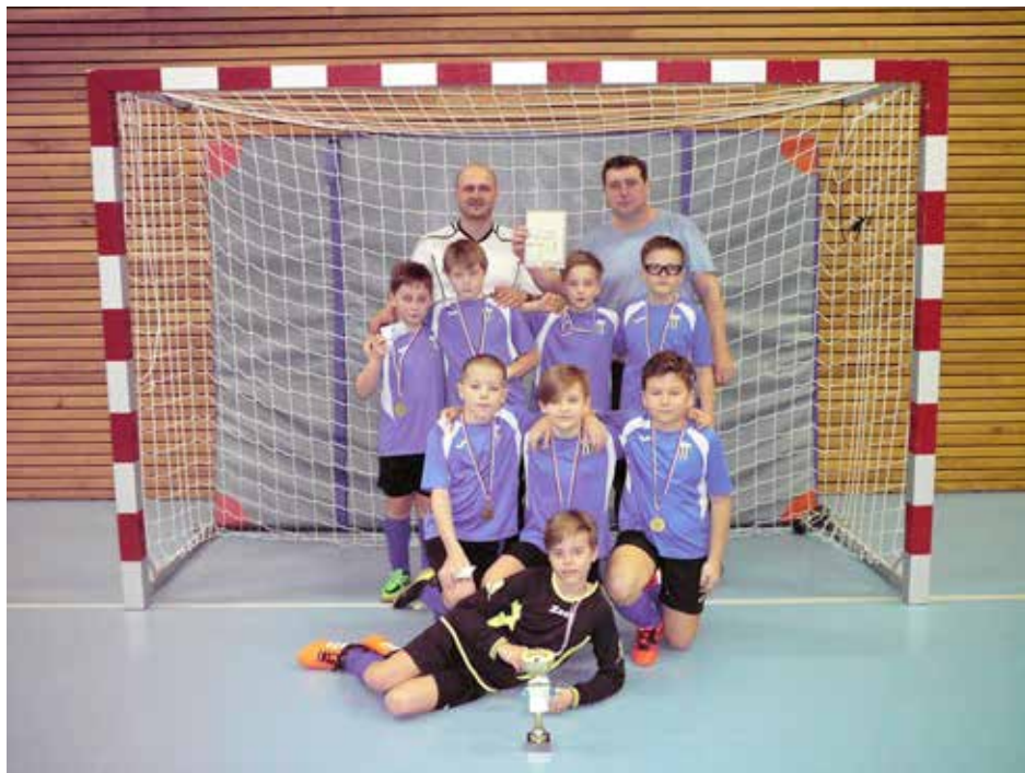
Baštěcká příprava s pohárem vítězů.

I ročníky 2008 se v lednu zúčastnily fotbalového turnaje a to v Odolene Vodě. Účastnilo se ho 6 týmů a s výjimkou SK Bašť a FC Mělník se jednalo o pražské kluby. Úroveň turnaje tedy byla vysoká. Kluci byli skvěle motivovaní a těšili se na hru. Tým SK Bašť obsadil na turnaji krásné čtvrté místo. Důležitější než výsledky je pro děti možnost zahrát si „skutečné“ zápasy, které jsou pro ně především velkou odměnou za jejich práci během tréninků a zároveň možností ukázat se před rodiči a sourozenci.