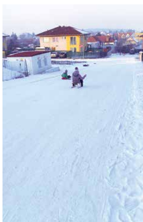
Ulice Nad Dvorem slouží i k sáňkování. Foto: OP Líbeznice