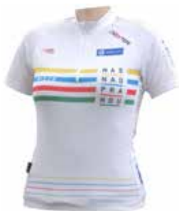
Unikátní dres pro vítěze Mistrovství Nad Prahou

„Stačí, když bydlíte v Bašti nebo v dalších z 31 obcí regionu Nad Prahou, máte horské kolo a hlavně máte chuť v neděli nelenošit. Nemusíte být profesionálními sportovci, abyste se stali Mistry regionu Nad Prahou v jedné z 23 kategorií“ přibližuje podmínky