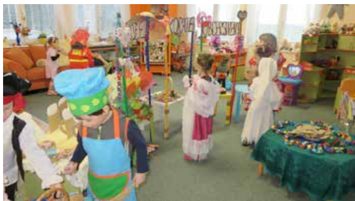
Masopustní jarmark ve třídě Korálků.

Jako každým rokem, tak i letos jsme pro děti z naší mateřské školy uspořádali již tradiční Masopustní karneval s následným průvodem obcí. Předcházely mu dlouhé přípravy, kdy jsme s dětmi chystali různé výrobky na náš masopustní jarmark.