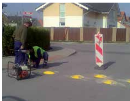
Instalace fyzických překážek na komunikaci.

Jako jednu z klíčových kapitol považujeme koncept dopravy Nad Dvorem . Doporučení společnosti AF-CityPlan, která je autorem výše zmiňované studie, obsahuje různé varianty (jednosměrný provoz, střídavý obousměrný provoz v jenom jízdním pruhu atd.).