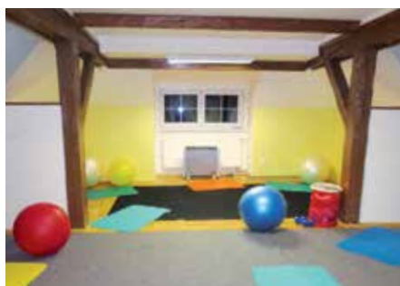
Staronové prostory pro cvičení seniorů ve Vile.