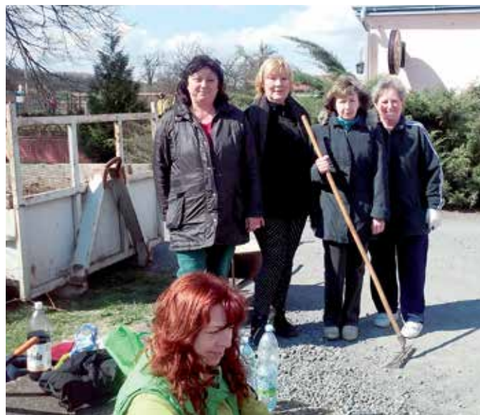
Již tradičně zahrádkáři probouzejí park u Vily ze zimního spánku.

Zahrádkářství v Bašti má dlouholetou tradici. Vždyť každý přece chce mít svoji zahrádku pěknou a mít z ní i užitek. Kdo ochutnal čerstvě utržené rajče, jablko nebo jahodu ví, o čem mluvím.