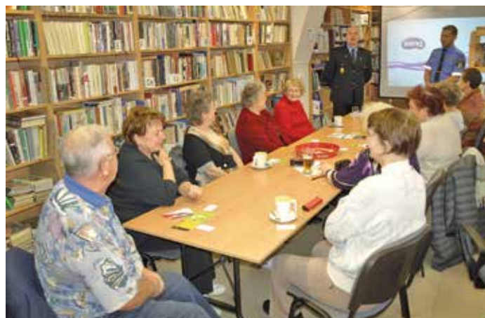
Baštěcká knihovna je oblíbeným místem setkávání seniorů.

Dovolte mi, abych na tomto místě poděkovala za stálou přízeň místní