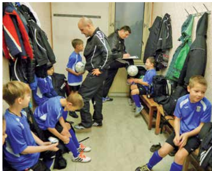
Okamžiky přípravy před zahájením Turnaje nadějí.

Více na: http://www.ofspv-turnaje.eu/starsi-pripavy/jaro/divize-f/ (Martin Opava, redakčně kráceno)