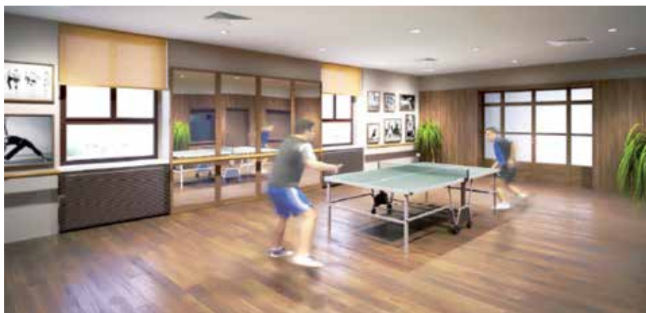
Návrh vzhledu „malé“ tělocvičny U Oličů Autor: Hexaplan International Brno

Ti z vás, kteří se již seznámili se schváleným rozpočtem obce, vědí, že je schodkový a že výše schodku dosahuje skoro 14 miliónů korun. Výše výdajů v letošním roce je dána především rekonstrukcí objektu U Oličů, která je rozpočtována na 28 miliónů korun. Splácení úvěru, který obec na realizaci rekonstrukce získala, ovlivní hospodaření obce až do roku 2030. Pokud budeme chtít realizovat další investiční projekty, bez národních nebo evropských dotací se neobejdeme.