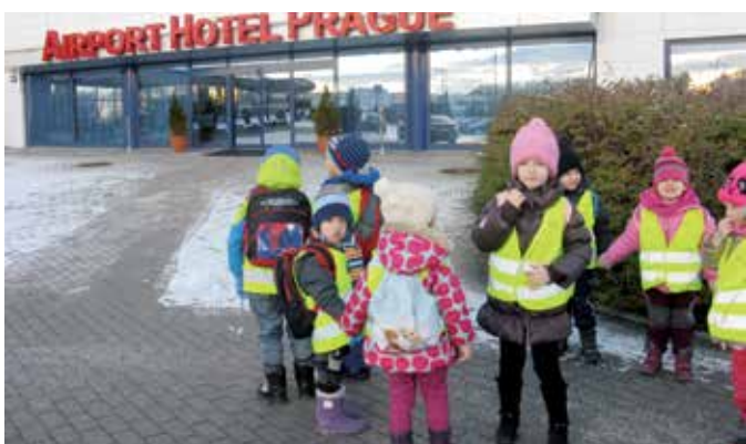
Z exkurze na Letišti Václava Havla v Praze.