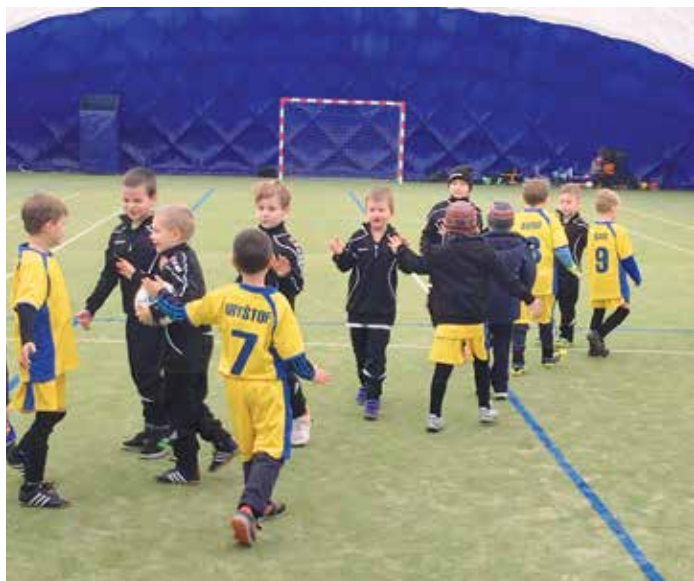
Nejmenší fotbalisté po skončení přáteláku v Klecanech.

První novoroční neděli se tým starší přípravy (ročníky 2007 a mladší) zúčastnil halového Turnaje nadějí pořádaného klubem FC Mělník. Náš tým se zúčastnil i prosincového termínu tohoto turnaje a bylo tak možné srovnat výkon dětí po uplynutí přesně jednoho měsíce.