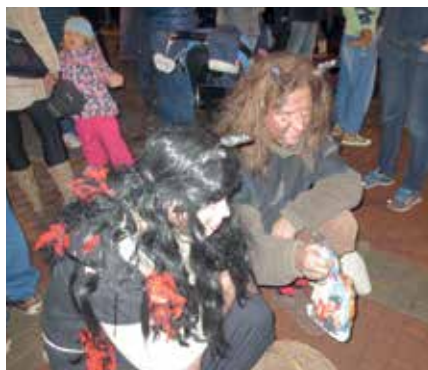
Hodní čerti rozdávali balíčky.