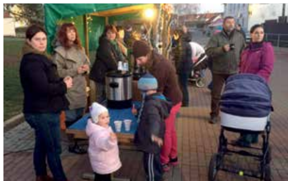
Několik desítek návštěvníků si vychutnávalo poctivý svařák.