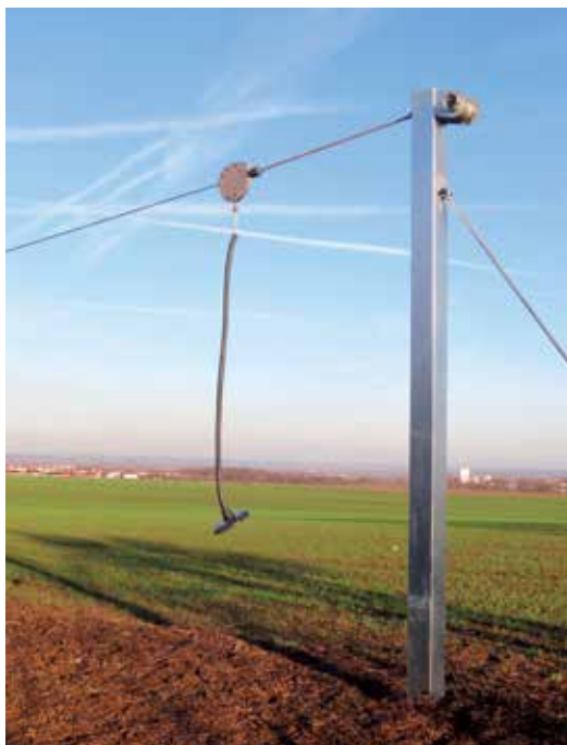
Na konci naučné stezky čeká děti lanovka.