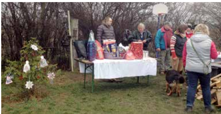
Na Vánoční sbírce nechyběl ani stromeček.