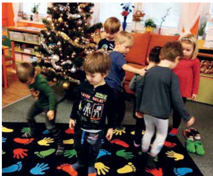
Pohybové aktivity ve školce podpořil i Ježíšek.

nejsou z domova zvyklé. Co se týče langoše nebo bramboráku, bylo to pouhé zpestření stravy, objevily se v jídelníčku jednou za rok. Pokud rodiče sledují jídelníček ve školce nebo na webových stránkách, mohou personálu školky sdělit, že si nepřejí, aby dítě tento typ jídla jedlo.