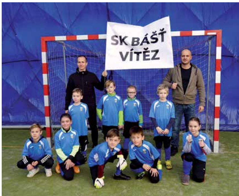
Vítězná sestava z Klecan.

V dalším zápase si kluci poměřili síly s Brozany (0:3), tady už bylo vidět pár krásných akcí, dokázali jsme si udělat klíčky, zpřesnit přihrávky a začali kombinovat hru. Poslední nás čekal Kolín (1:4). I když se kluci zápas od zápasu zlepšovali, dobře bránili a proběhlo i pár neproměněných brejků, tak kvality a zkušenosti soupeřů byli větší a to rozhodlo. Když se podíváme na soupeře, tak jsou to města s dlouholetou fotbalovou tradicí, kde mají velkou žákovskou základnu a na turnaje vybírají jen ty nejlepší. I tak jsme s nimi byli schopni udržet krok a být jim důstojným soupeřem. Zápas od zápasu bylo vidět na klucích, že se zlepšují a s při-