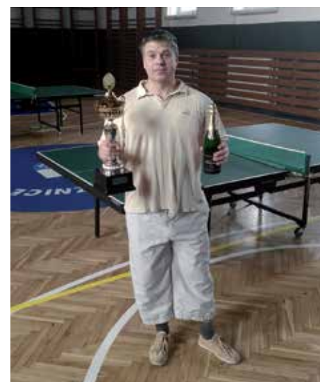
J. Kubát s cenami pro vítěze.