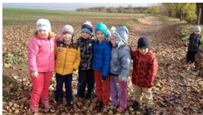
Děti ze třídy Korálky na podzimní vycházce.

V oblasti spokojenosti se stravou také záleží na individuálních stravovacích zvyklostech jednotlivých dětí. Většinou odmítají jídlo, na které