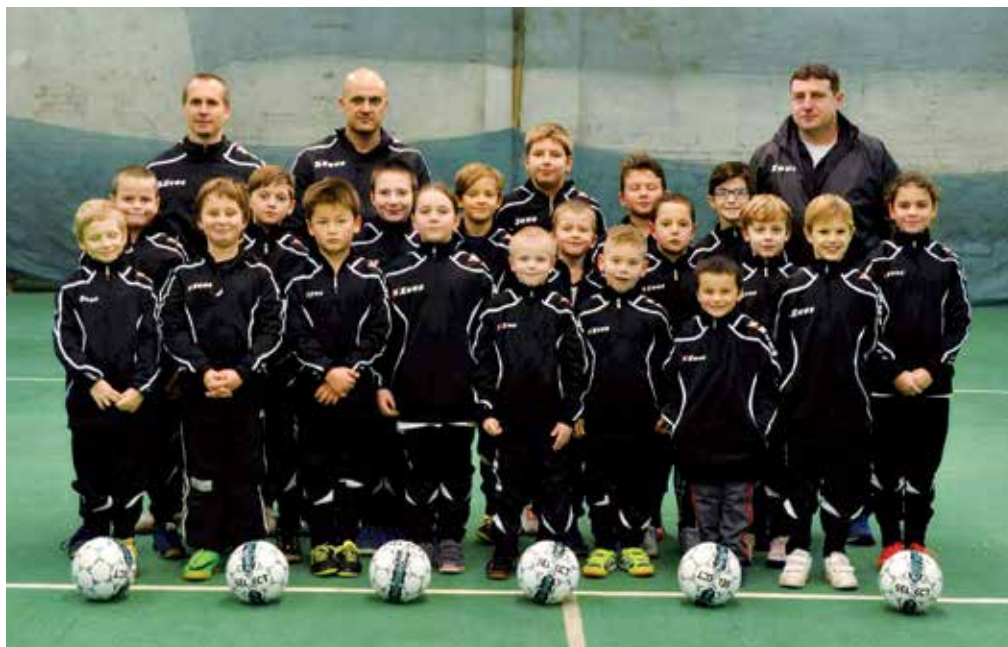
Družstvo starší přípravky SK Bašt v nových soupravách.

Jelikož se naše mužstvo skládá z různých věkových skupin, rádi bychom přivítali každého nového zájemce a rozšířili naši fotbalovou základnu o další kategorii. Kontaktovat nás můžete na emailu fotbalbast@seznam.cz nebo se přijďte osobně podívat na naše tréninky.