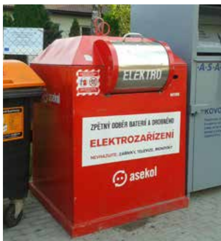
Kontejner na elektroodpad je umístěn na Návsi.

Úplná znění usnesení a celé zápisy naleznete na www.obecbast.cz nebo jsou k nahlédnutí v úředních hodinách na Obecním úřadě.