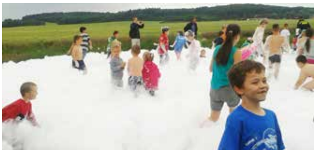
Na akci nechyběla v Bašti tradiční pěna.