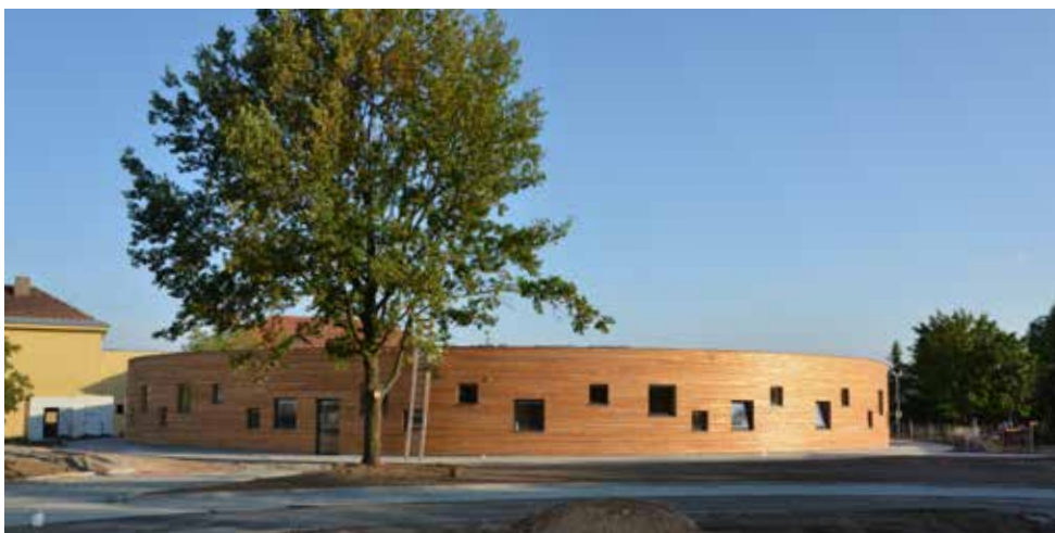
Rondel čeká na první žáčky.