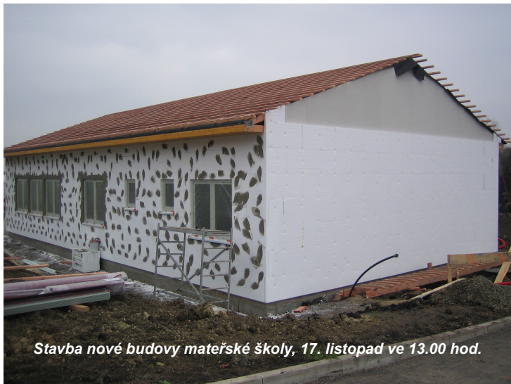
Stavba nové budovy mateřské školy, 17. listopad ve 13.00 hod.