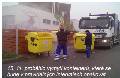
15. 11. proběhlo vymytí kontejnerů, které se bude v pravidelných intervalech opakovat