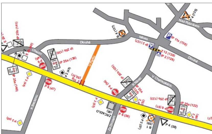
Návrh místní úpravy provozu na pozemních komunikacích v širším okolí Návsi