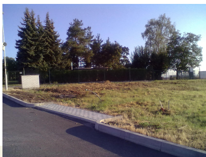
Pozemky 81/36 a 81/37, na kterých bude postavena nová MŠ

V uplynulých dnech získala obec všechna potřebná stanoviska ke stavbě nové mateřské školy. Stavební úřad zahájil sloučené územní a stavební řízení a na 10. září vypsal veřejné projednávání záměru. Zároveň obec zakoupila pozemky v lokalitě Za Horkou pro stavbu školky a Komerční banka schválila poskytnutí úvěru ve výši 5 mil. Kč pro stavbu prvního pavilónu MŠ. Projekt bude představen na zasedání zastupitelstva obce dne 17. 9. 2012 ve Středověkém hostinci, zároveň můžete postup prací sledovat na webových stránkách obce.