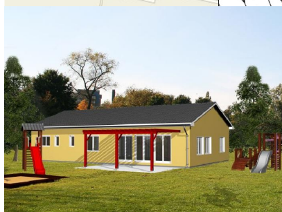
Vizualizace pavilónu MŠ a situáční nákres